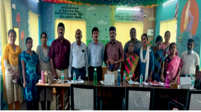
10 मार्च 2022 को बाल कल्याण समिति के साथ बैठक