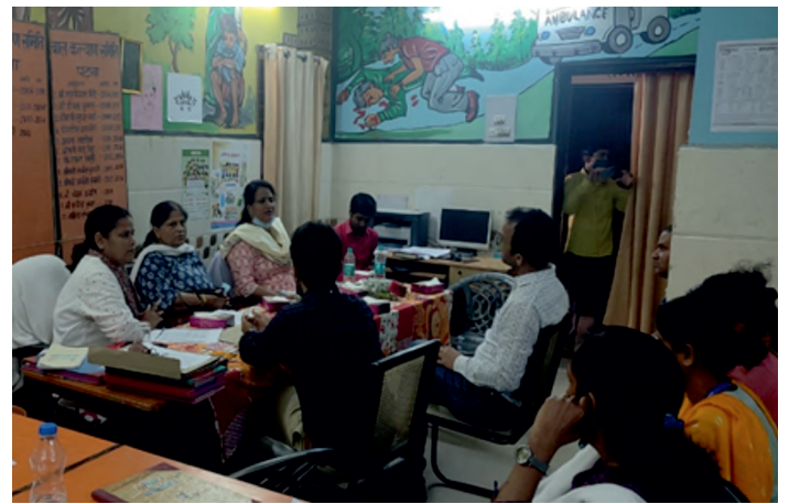
10.03.2022 को सीडब्ल्यूसी के साथ बैठक