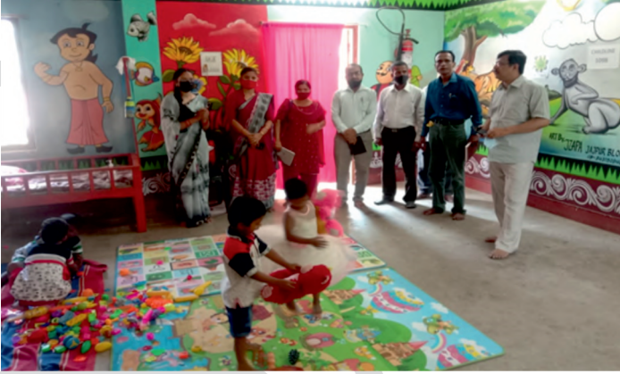
10 मार्च 2022 को बाल कल्याण समिति, जयपुर के साथ बैठक