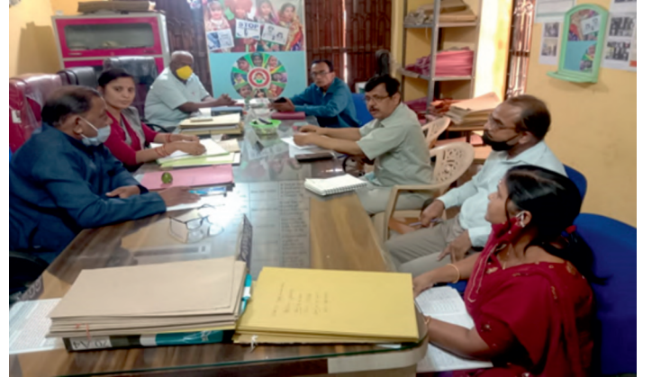
10 मार्च 2022 को बाल कल्याण समिति, धेनकनाल के साथ बैठक