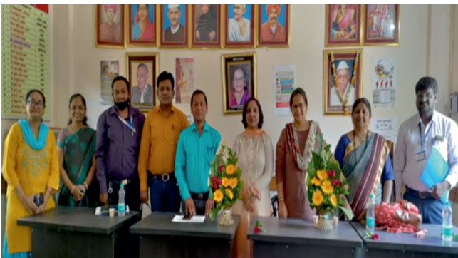
26 मार्च 2022 को बाल कल्याण समिति, औरंगाबाद के साथ बैठक