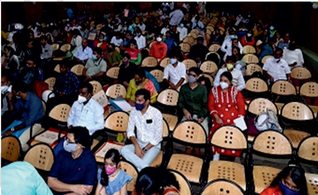
दत्तक माता-पिता और भावी दत्तक माता-पिता सम्मेलन, बेंगलोर