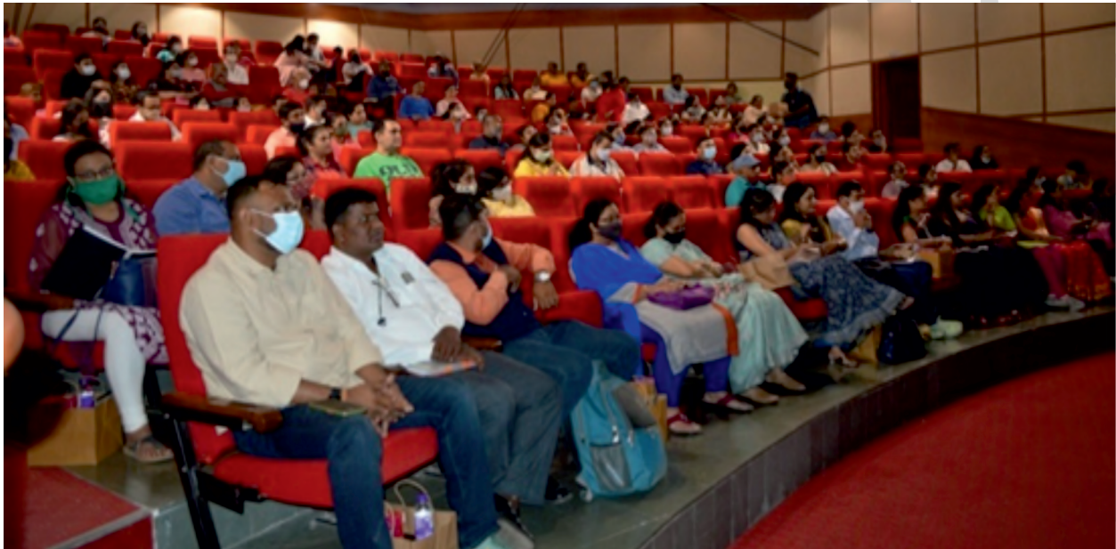
पुणे में दत्तक माता-पिता और भावी दत्तक माता-पिता सम्मेलन