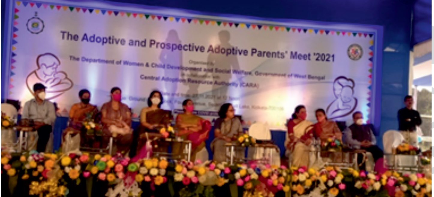
दत्तक माता-पिता और भावी दत्तक माता-पिता सम्मेलन, कोलकाता

कारा के प्रतिनिधि ने भाग लिया। कार्यक्रम में सार्थक विचार-विमर्श के लिए अपने बच्चों के साथ दत्तक माता-पिता, भावी दत्तक माता-पिता ने बड़ी संख्या में भाग लिया। इसके बाद बच्चों द्वारा सांस्कृतिक कार्यक्रम पेश किया गया। कारा के प्रतिनिधि ने एक दत्तक-ग्रहण एजेंसी का दौरा भी किया ताकि उसके मुद्दों और सरोकारों को समझा जा सके।