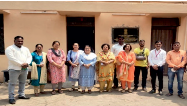
25 मार्च 2022 को बाल कल्याण समिति, अहमदनगर के साथ बैठक