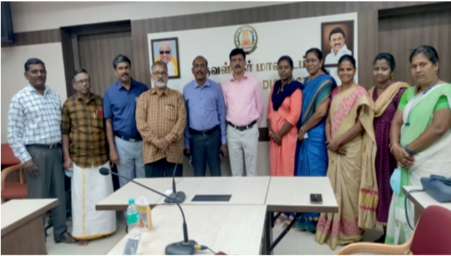
12 मार्च 2022 को बाल कल्याण समिति, तिरुवल्लुर के साथ बैठक