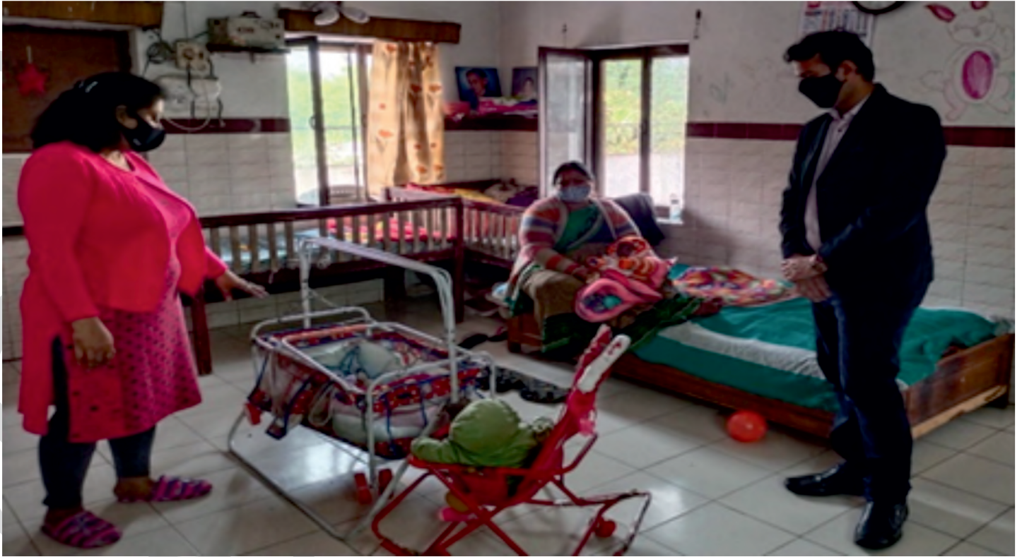
लखनऊ में एक दत्तक-ग्रहण एजेंसी का दौरा