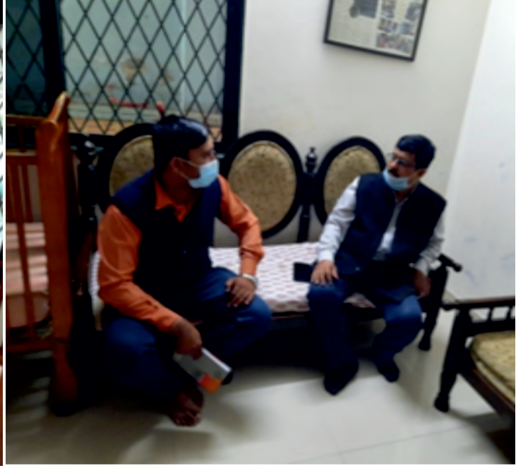
अरुणाश्रय, पुणे में फील्ड विजिट