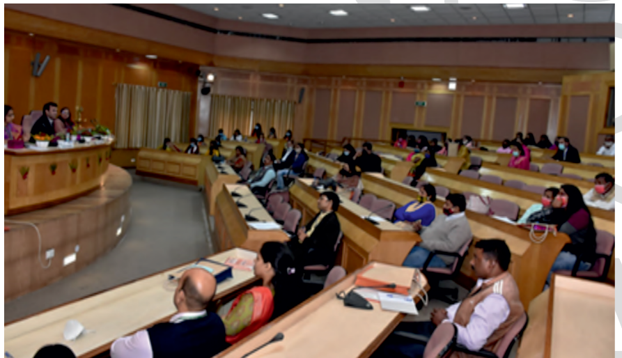
दत्तक और भावी दत्तक माता-पिता सम्मेलन और कानूनी दत्तक-ग्रहण संवर्धन सम्मेलन, लखनऊ

28 नवंबर 2021 को एसएआरए, उत्तर प्रदेश के सहयोग से निपसिड के क्षेत्रीय केंद्र परिसर, लखनऊ में भावी दत्तक माता-पिता और दत्तक माता-पिता की बैठक आयोजित की गई। इस बैठक का मुख्य उद्देश्य उनके मुद्दों और सरोकारों पर चर्चा करना और कानूनी दत्तक-ग्रहण की प्रक्रिया में उनके सामने आने वाली कठिनाइयों का समाधान करना था। कारा के प्रतिनिधि ने शहर में दो एसएए का दौरा भी किया।